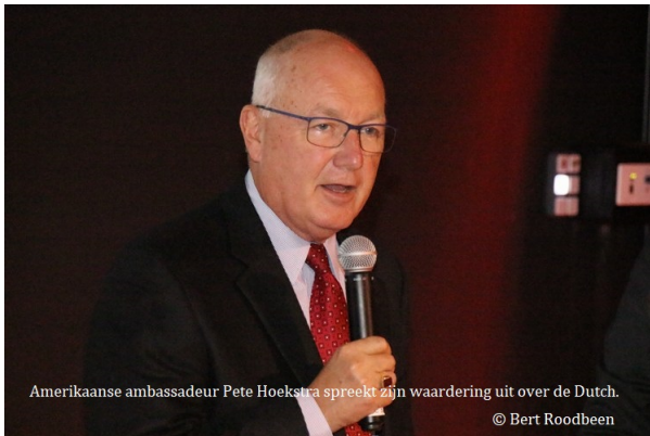
Amerikaanse ambassadeur Pete Hoekstra spreekt zijn waardering uit over de Dutch.